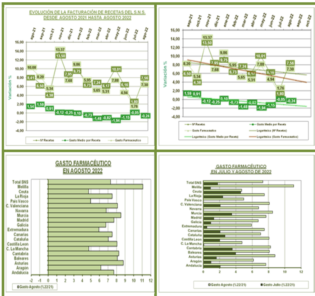
Tendencia Logarítmica dos periodos

El mercado de productos financiados en Oficina de Farmacia, aumenta nuevamente este mes, en comparación con el mismo mes del año anterior. La tendencia para los próximos dos meses es que continúe un mercado aunque menores crecimientos.