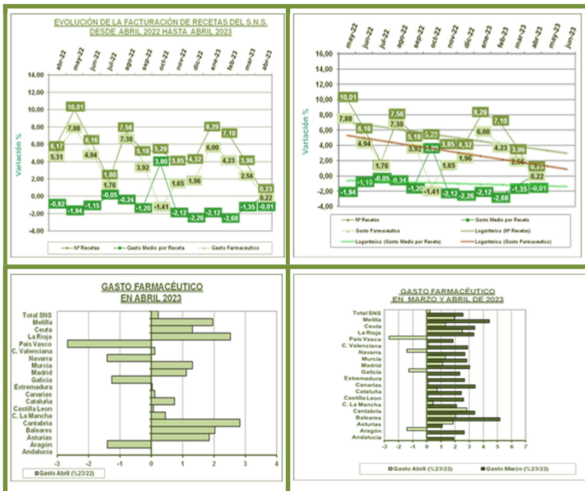
Tendencia Logarítmica dos periodos

El mercado de productos financiados en Oficina de Farmacia, aumenta nuevamente este mes, en comparación con el mismo mes del año anterior. La tendencia para los próximos dos meses es que continúe el crecimiento del mercado, aunque con menores aumentos, o incluso descensos, en comparación con meses del año 2022.