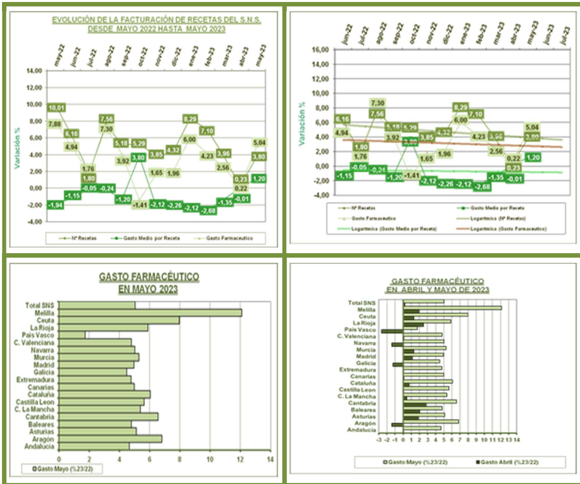
Tendencia Logarítmica dos periodos

El mercado de productos financiados en Oficina de Farmacia, aumenta nuevamente este mes, en comparación con el mismo mes del año anterior. La tendencia para los próximos dos meses es que continúe el crecimiento del mercado, aunque con menores aumentos, o incluso descensos, en comparación con meses del año 2022.