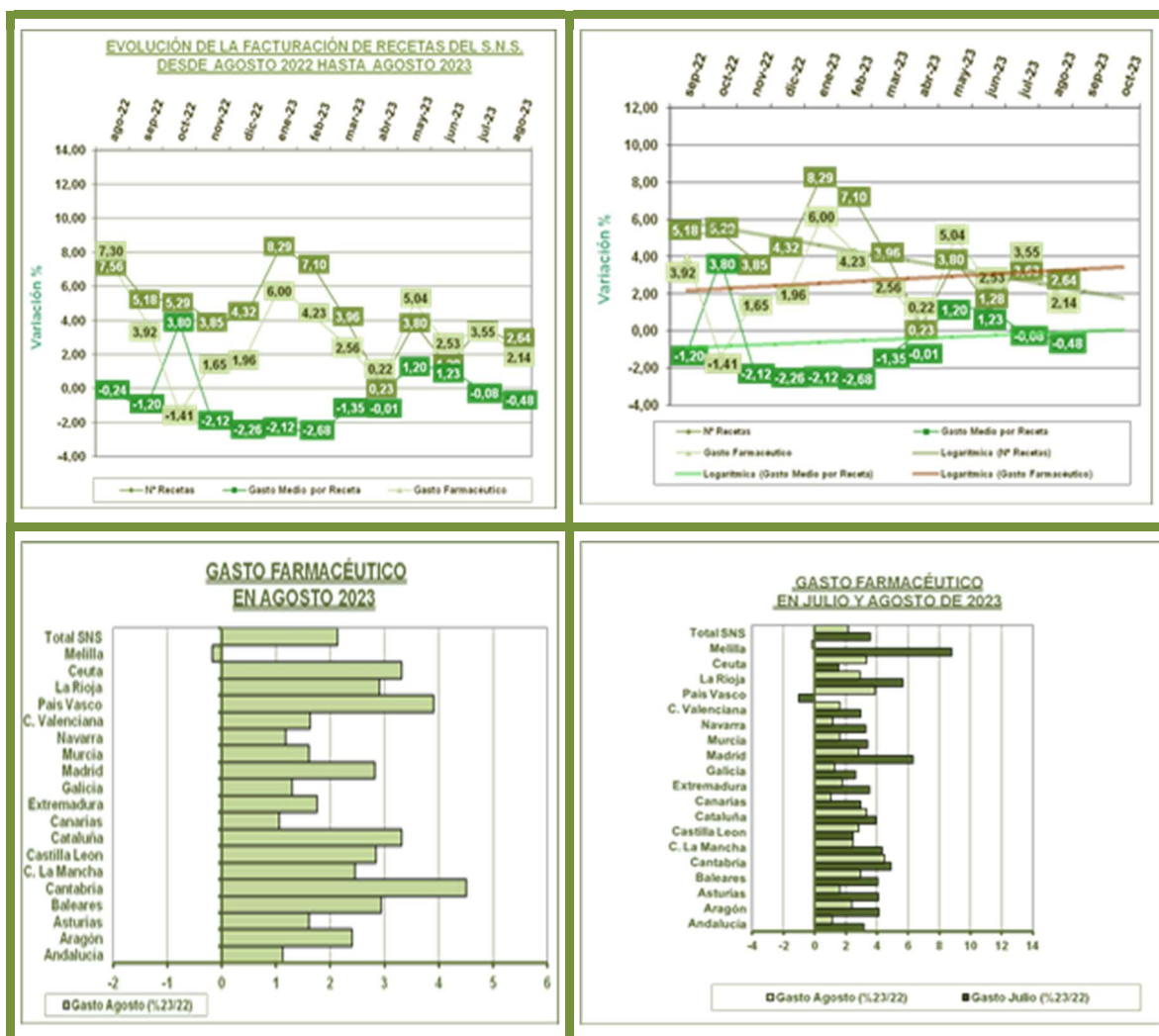
Tendencia Logarítmica dos periodos

El mercado de productos financiados en Oficina de Farmacia, aumenta nuevamente este mes, en comparación con el mismo mes del año anterior. La tendencia para los próximos meses es que continúe el crecimiento del mercado, aunque con menores aumentos, o incluso descensos, en comparación con meses del año 2022.