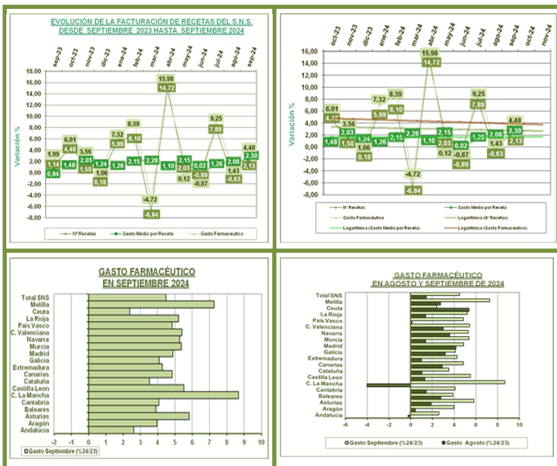
Tendencia Logarítmica dos periodos

El mercado de productos financiados en Oficina de Farmacia, aumenta este mes, en comparación con el mismo mes del año anterior. La tendencia para los próximos dos meses es que el mercado se estabilice.